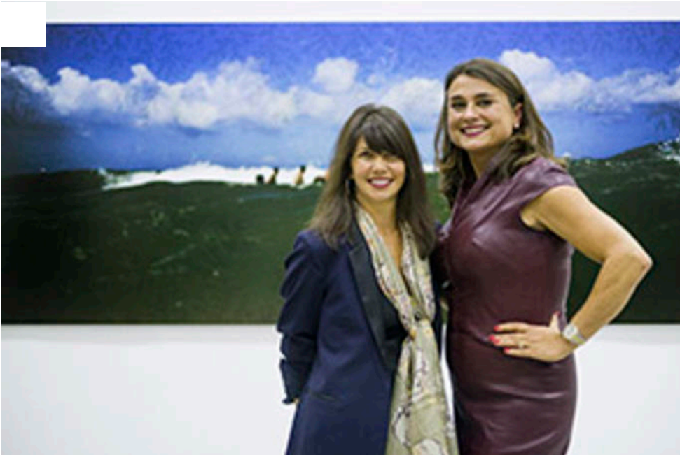
Fotografie und Netzwerken in der Barlach Halle K